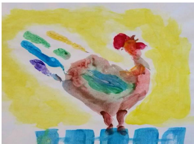
Петушок, выполненный из отпечатка ладони

Обратите внимание! Раскрытая ладонь более всего напоминает птицу. Поэтому с помощью данной техники можно сделать любую птичку на выбор малыша.