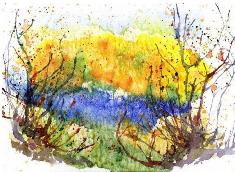
Нетрадиционная техника рисования в технике набрызга

Применение нетрадиционного рисования в детском саду идёт детям на пользу. Благодаря тому, что в рисовании можно использовать совершенно нетипичные для этого предметы, детям ДОУ открываются возможности нестандартного мышления. Получается, что они весело и с пользой проводят время. Они экспериментируют с различными методами рисования и пробуют разные способы самовыражения. Занятия развивают наблюдательность, творческие способности, художественный вкус. Образовательный процесс превращается в весёлую игру. Поэтому в детских садах всё чаще используют современные методы творческих занятий.