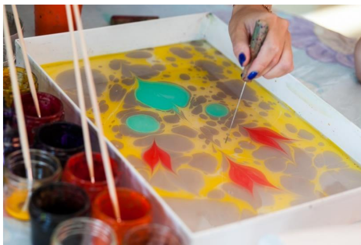
Рисунок на воде в технике эбру

Такая методика подходит для старших групп сада или младших классов школы. Занятия с эбру можно превратить в сказочную игру. Детям любых возрастов очень нравится данная техника. Не имея специальных навыков, уже на первом занятии можно почувствовать себя мастером эбру.