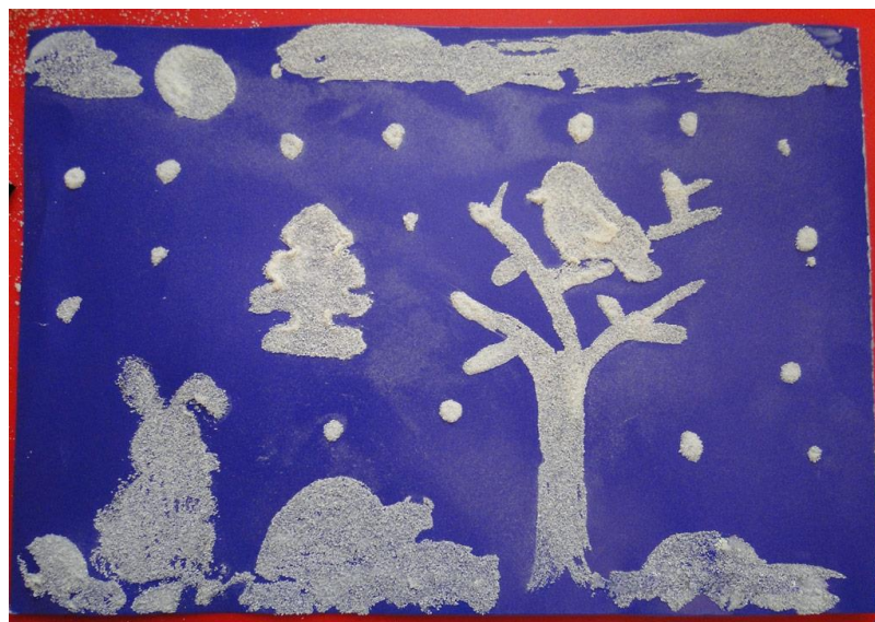
Заснеженная берёза, сделанная с помощью соли

Обратите внимание! Интересней и красочней использовать цветную крупу или песок. Для этого можно использовать пищевые красители или купить готовый цветной песок.