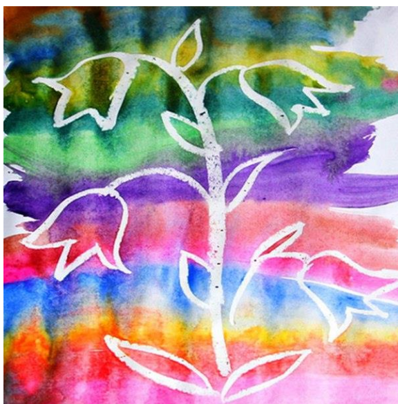
Пейзаж, нарисованный с помощью поролона

В данной технике можно раскрашивать животных, тогда они выходят как бы пушистыми.