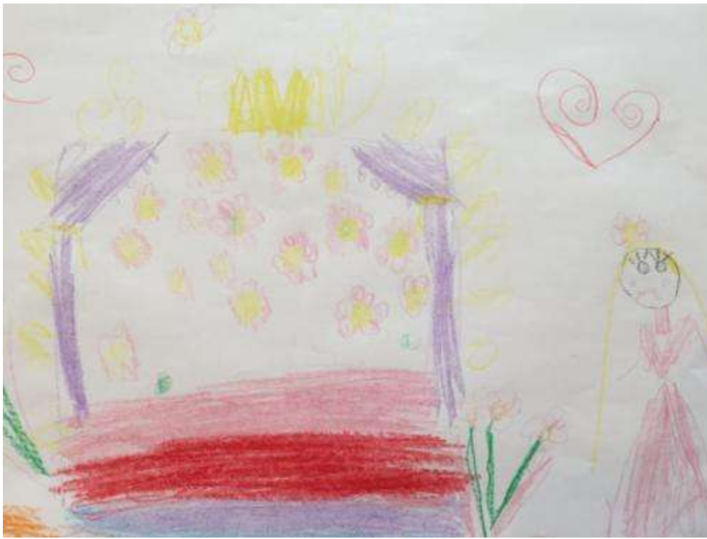
«Принцесса на горошине». Рисовала Лина Байбекова. Подг.гр. № 6.

Мы в королевской опочивальне. Как сверкает корона над пологом! А тюфяки-то, какие! А на тюфяках горошина... Рядом стоит принцесса.