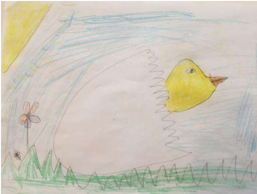
«Гадкий утёнок». Рисовал Максим Скутельник. Подг. гр. № 6

Вот и вылупился на свет маленький птенец! Он ещё не знает, что никакой он не утёнок. Много бед и несчастий